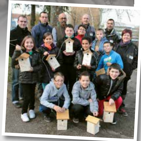
Toute l'équipe du service proximité Beausoleil à pied d'oeuvre pour encadrer les jeunes menuisiers !

Le projet a bénéficié de la collaboration logistique et financière de la Ville de Sarreguemines, de l'Agglo mais aussi de différents sponsors qui n'ont pas hésité à soutenir cette belle initiative.